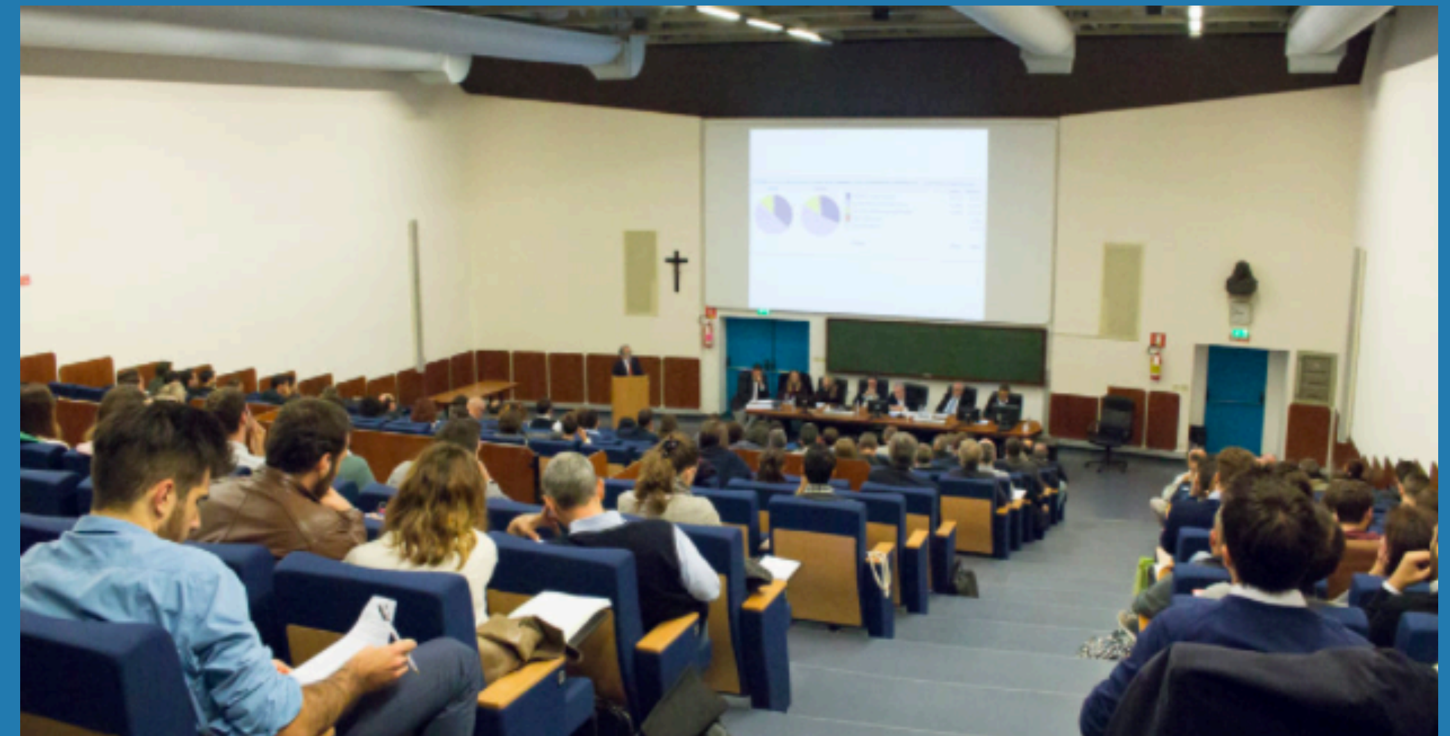
Aula Morgagni Policlinico universitario