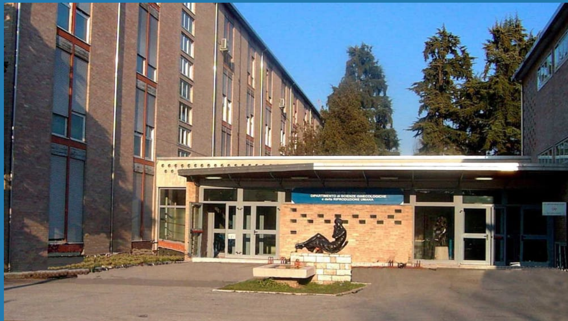
Reparto Ostetricia e Ginecologia